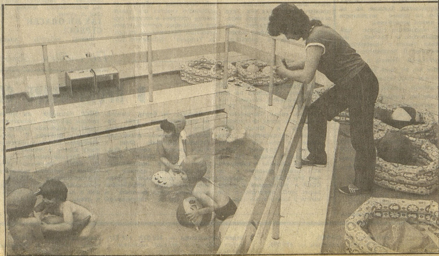
В бассейне детсада «Виту релис».